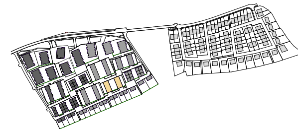
1.NP / FLOOR