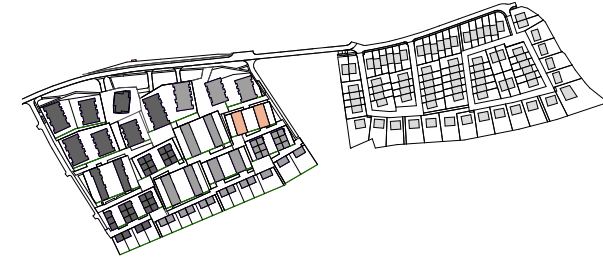
1.PP / FLOOR